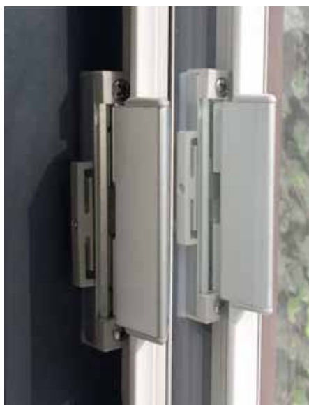
Verzwaarde afsluitbare zijsluiting